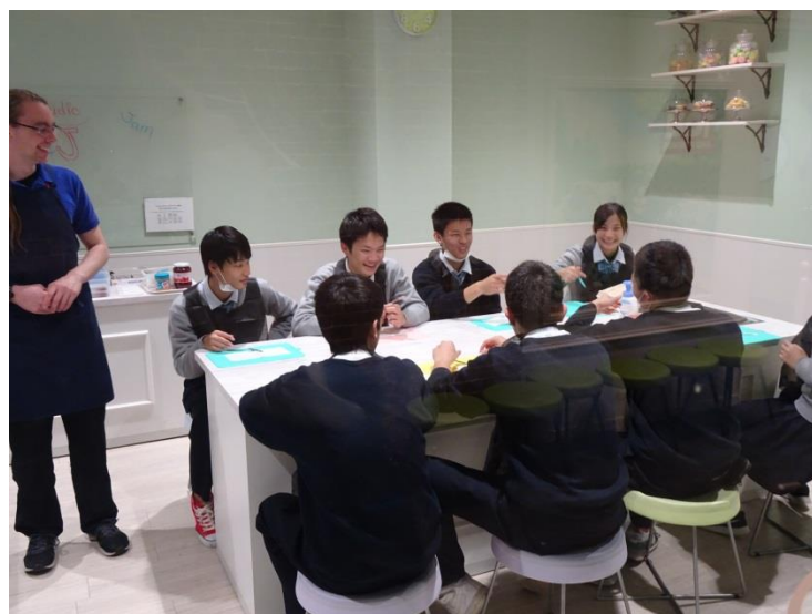
[クッキングスタジオ]