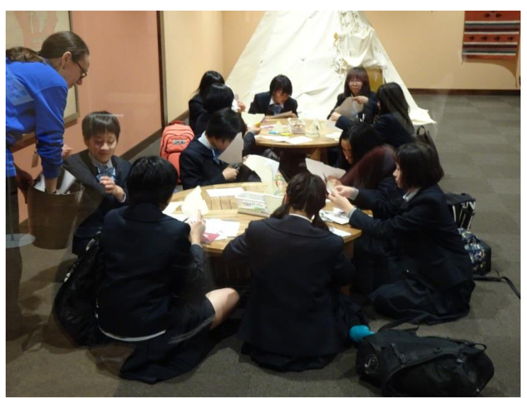
[ネイティブアメリカンヴィレッジ]