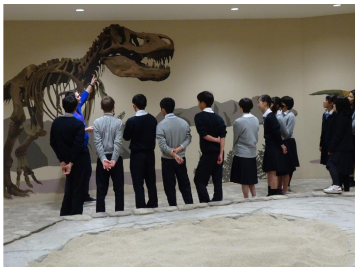
[ダイナソーパーク]

OEV は、英語を楽しみながら学ぶ体験型英語教育施設です。アメリカの日常や歴史、文化をテーマにした 23 のシチュエーションルームの中から、自分が興味を持てる LESSON を選んで、英語ネイティブのインストラクターとテーマに沿った内容の体験ができます。