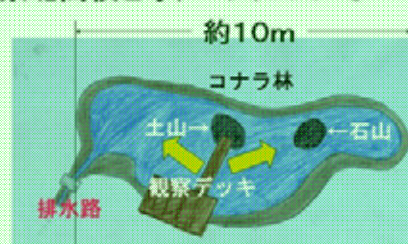
泉北高校ビオトープについて

展示のコーナーだけでなく、発表もあり、私たちも、泉北高校のビオトープ池について3年間調べてきた結果を発表しました。参加者として多かった小学生に合わせて、説明を簡単にしたり、イメージを持ってもらうためにスライドに図を多く載せたり、簡単そうですが逆に難しかったです。